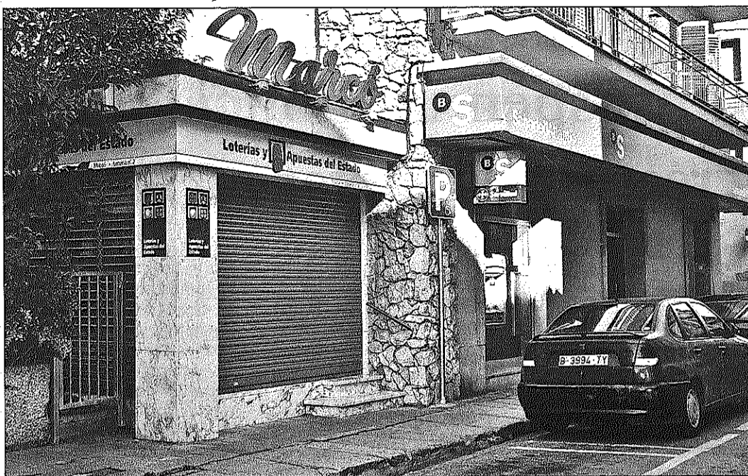
L'administració de loteria Marcó, de Sant Celoni, va vendre diverses sèries d'un tercer premi de la loteria de Reis

L'empresa que fa la recollida d'escombraries a la Llagosta, SERSA, ha incorporat tres vehicles elèctrics que es fan servir per recollir brossa després d'escombrar i els residus de les papereres. La Policia Local també va provar al novembre una moto elèctrica.