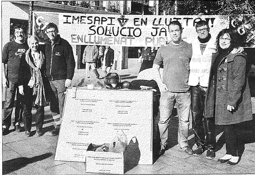
Una recollida d'aliments va formar part de les mobilitzacions associades a la vaga que va fer la plantilla d'Imesapi

Amb aquest acord culmina un prolongat conflicte que ha inclòs una vaga de més d'un mes. La plantilla rebutjava els motius que argumentava la direcció per aplicar un expedient al centre de treball