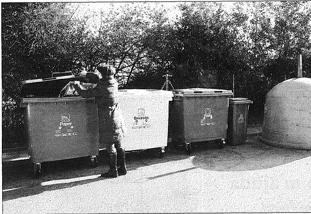
Una veïna diposita paper en un dels nous punts de recollida distribuïts per tot el poble

L'Ajuntament de Figaró ha convocat una plaça de mediador comunitari durant sis mesos corresponent al pla d'ocupació treball als barris de l'any 2012. Les sol·licituds s'han de presentar fins al 21 de gener a la 1 del migdia i les entrevistes seran el dijous 24. La feina és per sis mesos a partir del dia 1 de febrer i els aspirants han d'estar inscrits com a demanants de feina.