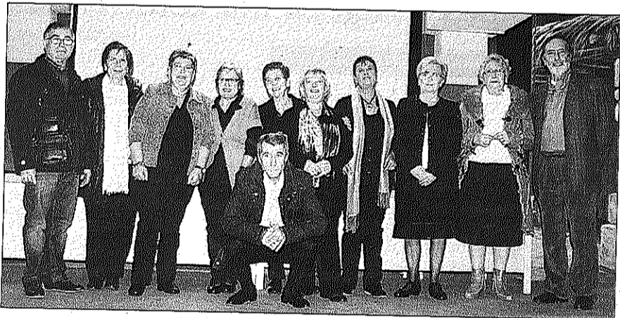
Els treballadors que es van jubilar l'any passat durant l'homenatge fet el 19 de desembre

L'institut El Til·ler, de les Franqueses; l'escola Ginebró, de Llinars i l'escola bressol La Baldufa, de Vilanova, han rebut el distintiu d'Escola Verda que atorga el Departament de Territori i Sostenibilitat. Són centres que han finalitzat el pla d'acció triennal per a la sostenibilitat.