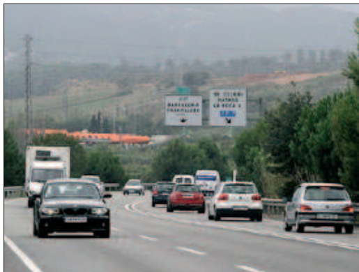
L'actuació s'ha de completar en un futur amb la instal·lació de separadors

Segons han informat fonts del Departament de Territori i Sostenibilitat, entre dilluns i dimecres hi haurà tallat un dels tres carrils i es mantindrà obert un sol carril per sentit. Els tallats començaran a les 9 del matí i s'allargaran fins a les 8 del vespre, dilluns; fins a les 6 de la tarda, dimarts, i fins a les 3 de la tarda, dimecres. La nit de dimarts a dimecres –entre les 10 de la nit i les 6 de la matinada– es tancaran dos carrils en el tram d'obres. Per tant, només en quedarà un d'obert. Per aquest motiu,