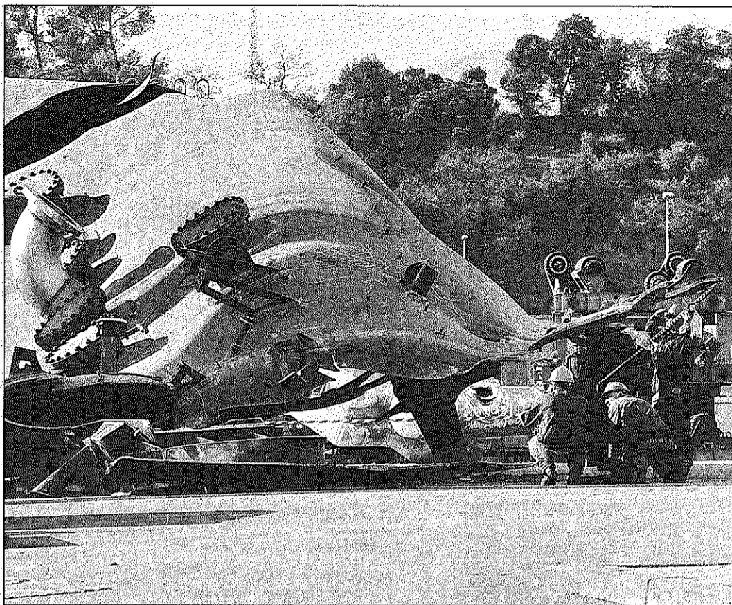
Uns tècnics es miren aquest divendres les restes del gran dipòsit que va esclatar dijous a la tarda