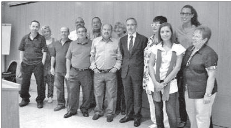
La nova junta de l'associació de veïns del Lledoner, divendres al vespre, al centre cívic Nord