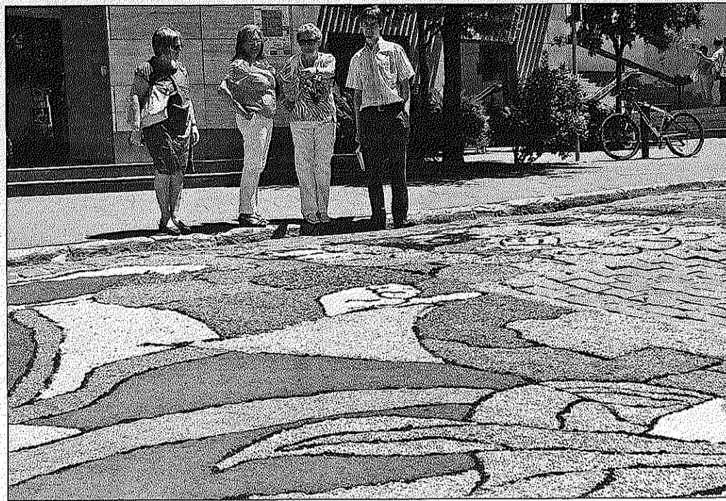
Una de les catifes fetes l'any passat als carrers de Caldes