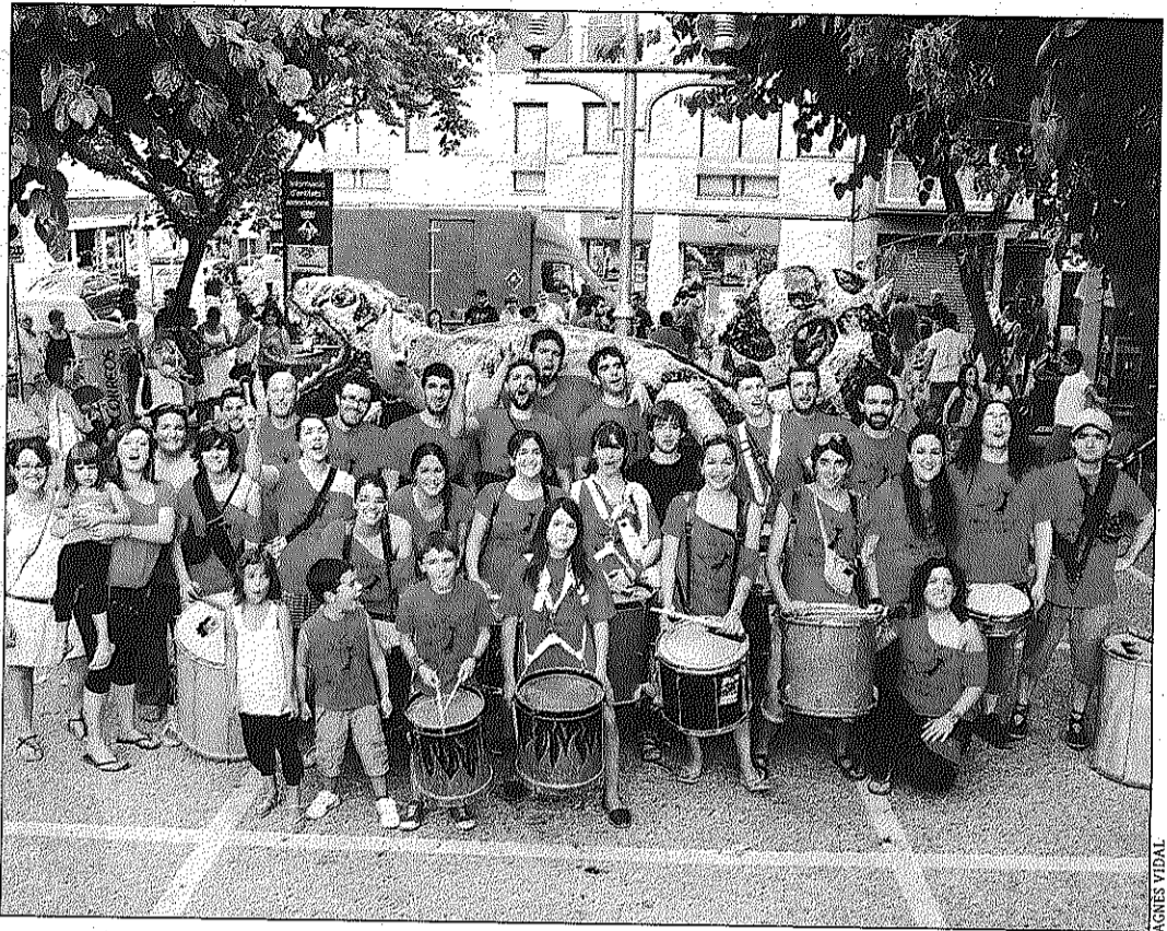
La Colla de Diablers de Sant Celoni va presentar el nou tritó divendres al vespre

Amb els balls i la benvinguda oficial a l'estiu feta, un miler de persones van celebrar que l'estiu havia arribat al parc de la Rectoria Vella amb els concerts de les formacions Mandanga i Txarango.