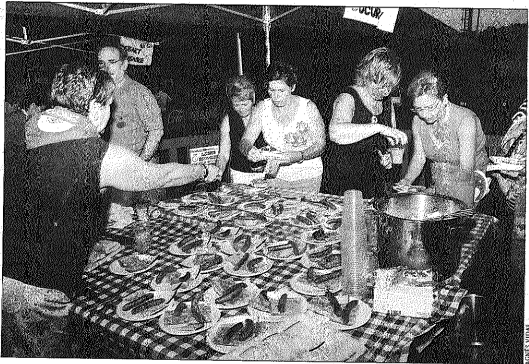
En la degustació d'aperitius es van haver de muntar unes carpes per a les entitats

Els gegants, la música, els balls, el foc i els jocs també van formar part de la festa major que, un any més, enfrontava les colles de Melons i Creuats en diferents proves. Tot i que els Creuats tenien avantatge, la colla guanyadora no se sabrà fins al proper cap de setmana, en què es faran dues proves més: Omplim el rebost del Banc dels Aliments i el Sopar Popular. El veredictes es farà públic a les 11 de la nit a la plaça de la Quintana.