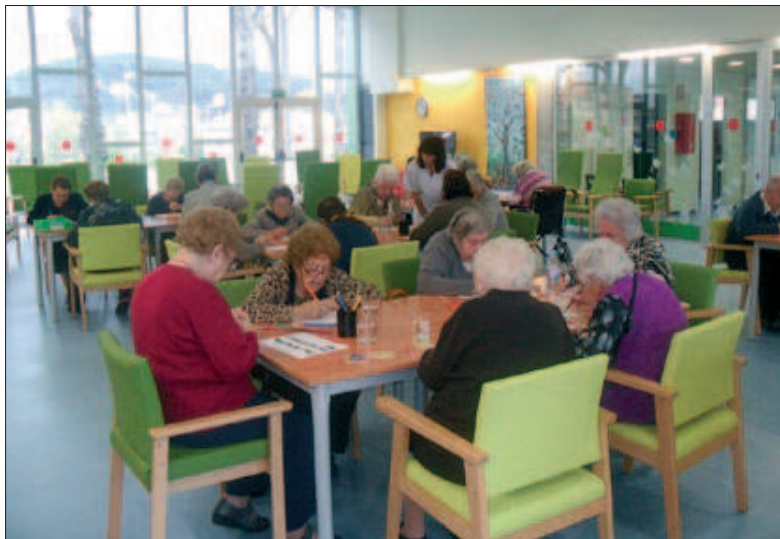
El Centre de Dia va inaugurar-se al gener i ofereix moltes activitats als usuaris, com tallers de manualitats

D'aquesta manera, si una família necessita els serveis del Centre de Dia, té les dues opcions. Per la via pública, cal inscriure l'avi o àvia en una llista d'espera del Departament de Benestar Social de la Generalitat. Per poder fer la inscripció, el sol·licitant ha d'acreditar poder-se acollir a la Llei de Dependència, en graus 2 i 3. "Són persones que neces- sitem que estiguin per ells,