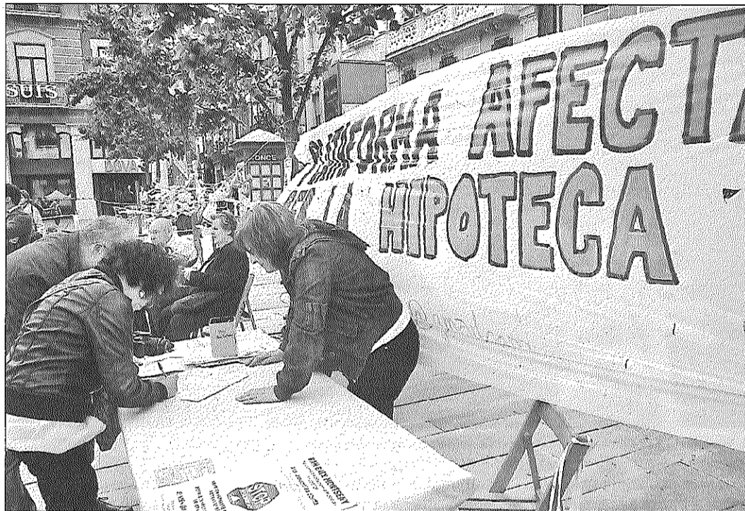
La PAH del Baix Montseny va organitzar una recollida de signatures, dissabte, per una nova llei de l'habitatge