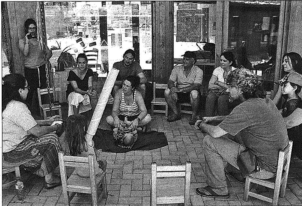
Durant tres dies, s'han fet xerrades, concerts i altres activitats a l'escola bressol La Font del Rieral

Amb aquestes jornades de portes obertes, l'Assemblea desestimava una tancada que s'havia estat plantejant per donar, en canvi, una imatge "en positiu" de les mobilitzacions impulsades per salvar