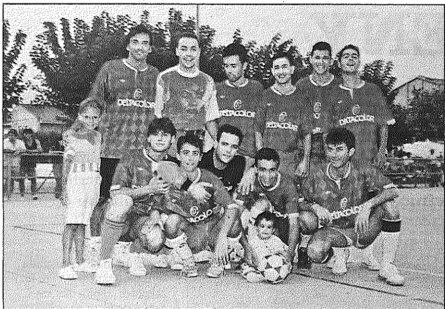
L'equip Deltacolor va ser un dels equips punters de la competició durant els anys 90