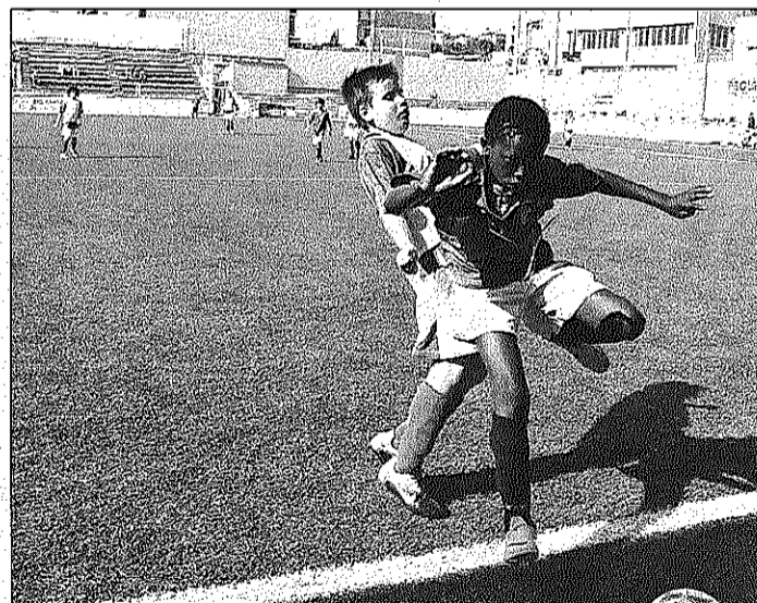
Dos joves jugadors lluiten per una pilota en un dels partits del torneig

En categoria aleví, els tres equips del Granollers que