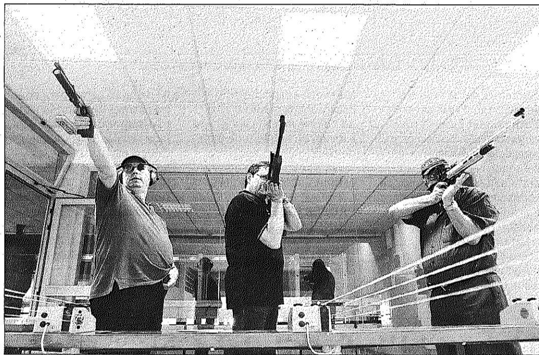
El tir de precisió requereix resistir la tensió en posició immòbil, concentració i control de la precisió

ta renovació els ha convertit en el club amb les instal·lacions punteres a Catalunya, que compta amb una quinzena de clubs de tir. "També tenim el calendari esportiu més important de tots", assegura Pérez, "organitzem més de 200 competicions anuals".