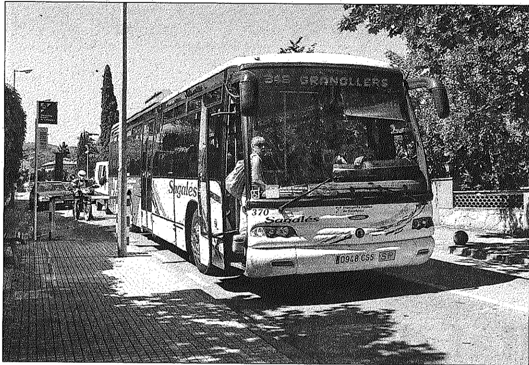
El servei municipal de l'Ametlla es complementa a algunes hores amb la línia entre Sant Feliu i Granollers