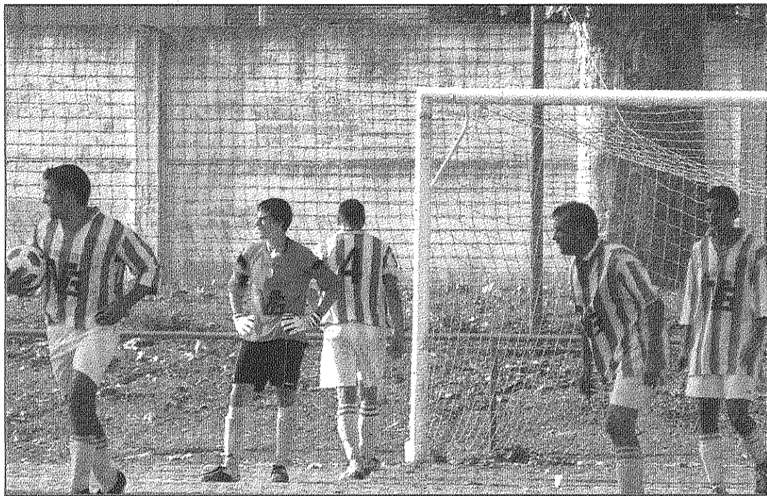
El CE la Batllòria rep, avui, a dos quarts de 5 de la tarda al CF les Franqueses (AdBM)

Més mala peça al teler té el CE la Batllòria, que aquest dissabte, a dos quarts de 5 de la tarda, rep al CF les Franque-