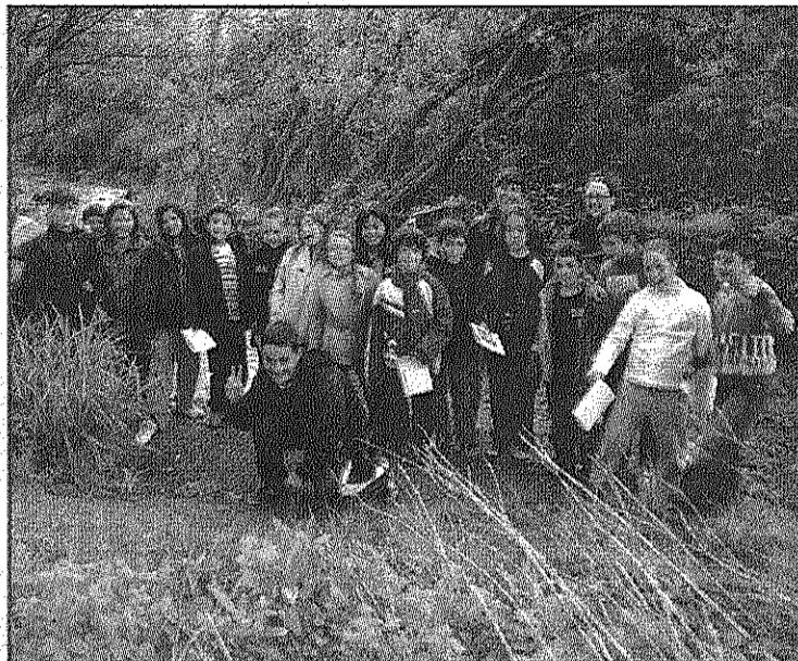
Alumnes del Pallerola a la sortida al Pertegàs (AdBM)

En el marc d'aquest programa, Sánchez va ser dimecres a l'escola Pallerola de Sant Celoni i divendres a l'escola Montnegre