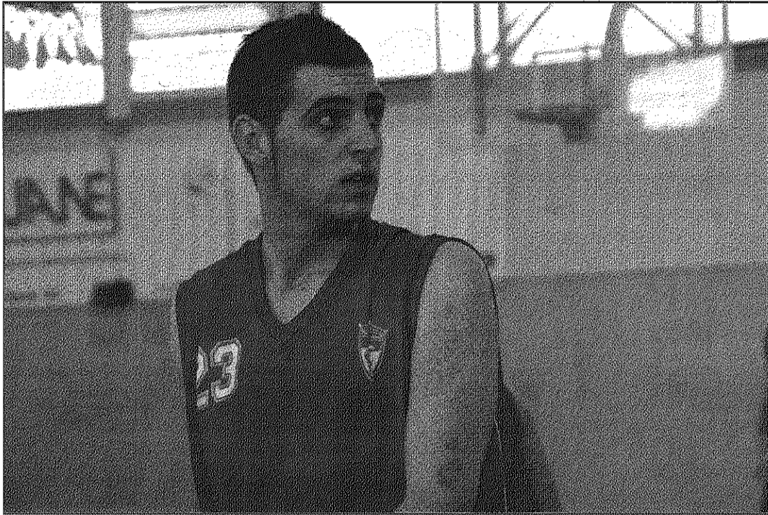
El CB Llinars rep a casa, diumenge a les 6 de la tarda, el CB la Garriga (AdBM)

Per la seva banda, el CB Sant Celoni juga aquest dissabte, a un quart de 5 de la tarda, a la pista de la Universitat Abat Oliba-Ceu. Els dos equips, empatats a 15 punts a la zona mitjana de la classificació, fan jornades que es troben matemàticament salvats de la zona de descens però també sense opcions pel que fa a la zona alta. Més després que a la darrera jornada els celonins van caure per un ajustat 53-54 en el derbi davant el CB Cardedeu que sí deixa els cardedeuencs en una destacada segona plaça. Aquest cap de setmana, el CB Cardedeu no tindrà partit ja que el partit davant el CB la Salle Horta el va