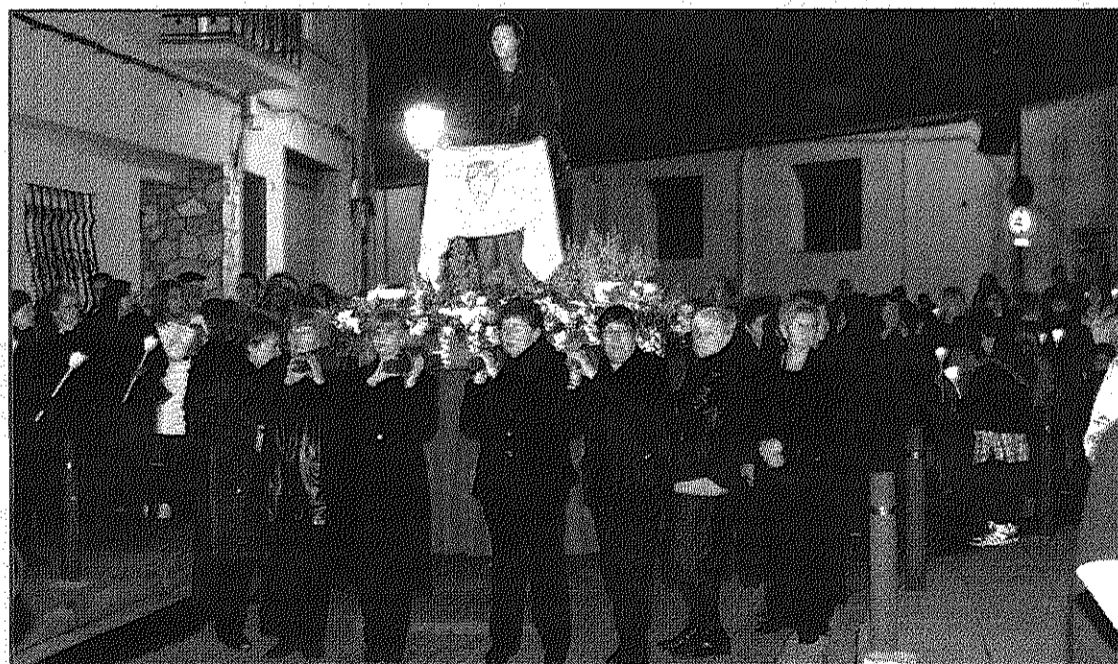
El misteri de la Dolorosa va ser portat per un grup de dones per la vila (JORDI BLAS)