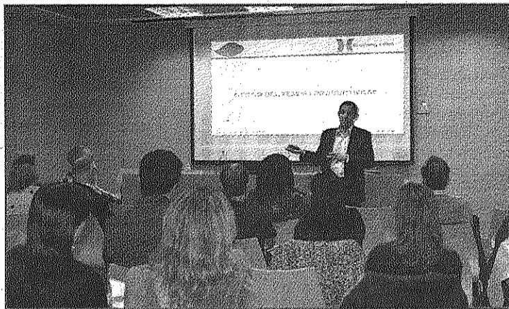
Adame va tancar la trilogia de conferències (Susss)

En aquesta darrera ponència, Adame va posar sobre la taula la problemàtica de la gestió del temps i la productivitat que ve donada pels resultats obtinguts i el temps emprat. En aquest àmbit, el ponent va destacar que cal fer-se la pregunta si, en una època com l'actual, de reducció de costos, s'està pensant prou en gestionar l'excedent de temps per millorar la qualitat del servei o producte o per innovar. També va parlar de com arribar-hi si, sovint, es té la sensació que no s'arriba a tot. En aquest sentit, va assenyalar que per poder disposar de temps cal organitzar-se a partir de pautes com tenir un