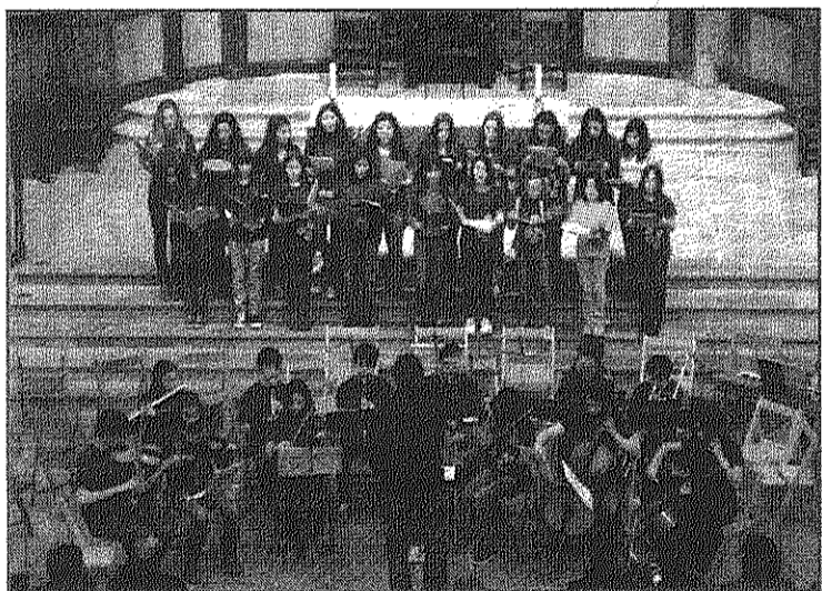
Una imatge del concert ofert a Bergara (AdSC)