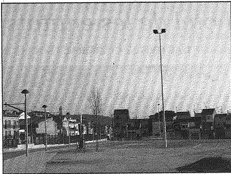
A punt d'obrir el nou aparcament a la Forestal (AdbM)

L'obertura d'aquesta zona incrementarà ostensiblement les places d'aparcament públic