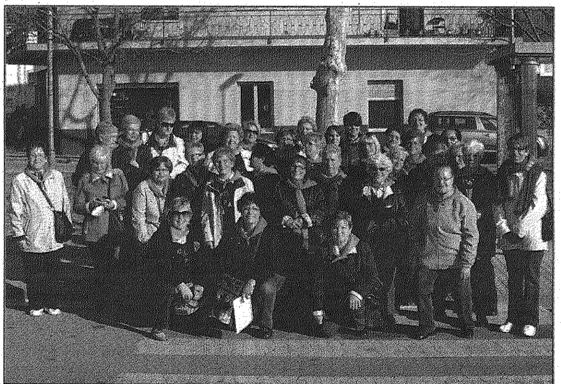
Imatge de les alumnes de patchwork i altres veïnes participants a la sortida (AGBM)

treballs de tot tipus elaborats amb patchwork, van adquirir material per desenvolupar aquesta tècnica de cosir i van poder agafar idees per als seus propers treballs. Després d'un dinar de germanor, les participants van tenir la tarda lliure per tornar a la fira, visitar els llocs més emblemàtics de Sitges o bé prendre alguna cosa admirant el paisatge marítim. L'expedició va resultar tan positiva que les participants ja han programat una nova sortida. Serà a la fira del patchwork que acollirà al setembre Sant Feliu de Guíxols. Les persones interessades a assistir-hi s'hi poden inscriure al Centre Cívic les Casetes o per telèfon al 938 470 159.