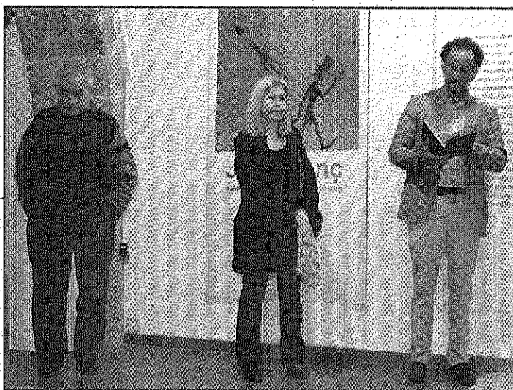
Una imatge de la inauguració de l'exposició