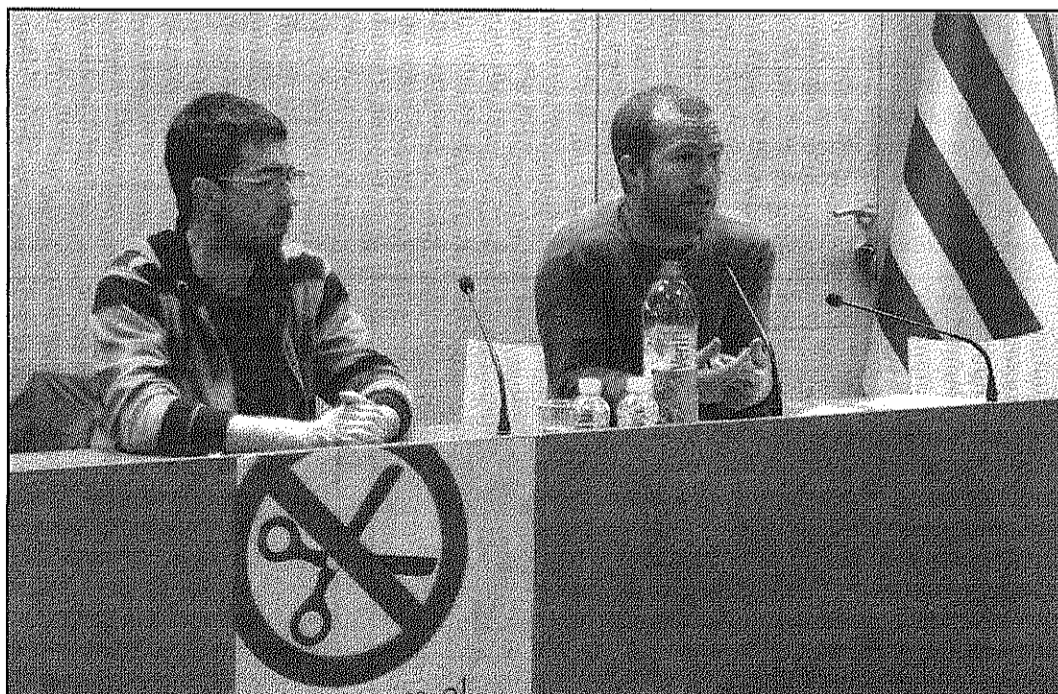
Una imatge de l'acte celebrat dissabte a convocatòria de la CUP a la sala Bernat Martorell