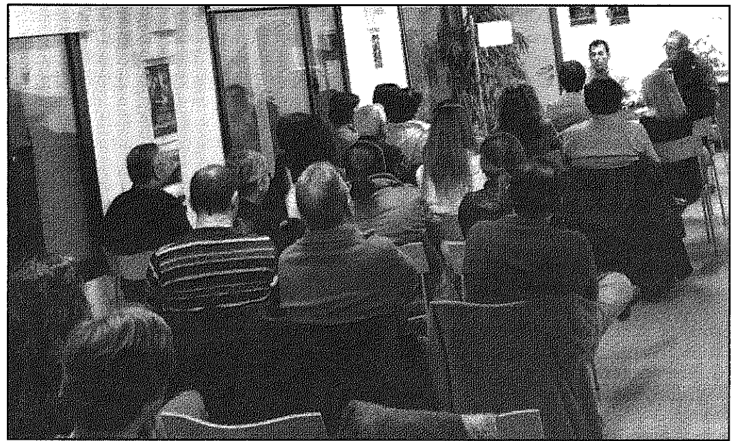
Una imatge de la sessió del Tast de Lletres amb l'escriptor Víctor del Árbol (AdBM)