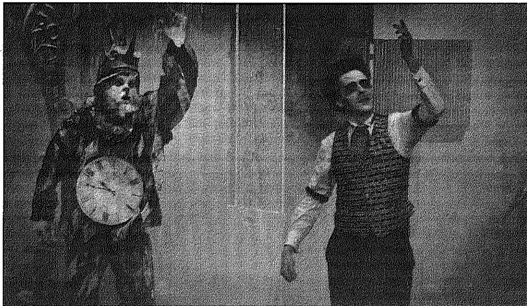
Una imatge de l'espectacle que el Mag Edgard va oferir a Sant Celoni dissabte (SERGI ROEL CREUS)