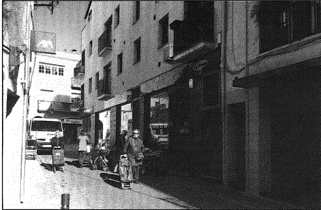
El robatori es va produir al número 1 de la plaça Joaquim Sagnier de Sant Celoni (AaBM)

Segons Gas Natural, els tècnics de la companyia es van ocupar del tancament de l'es-