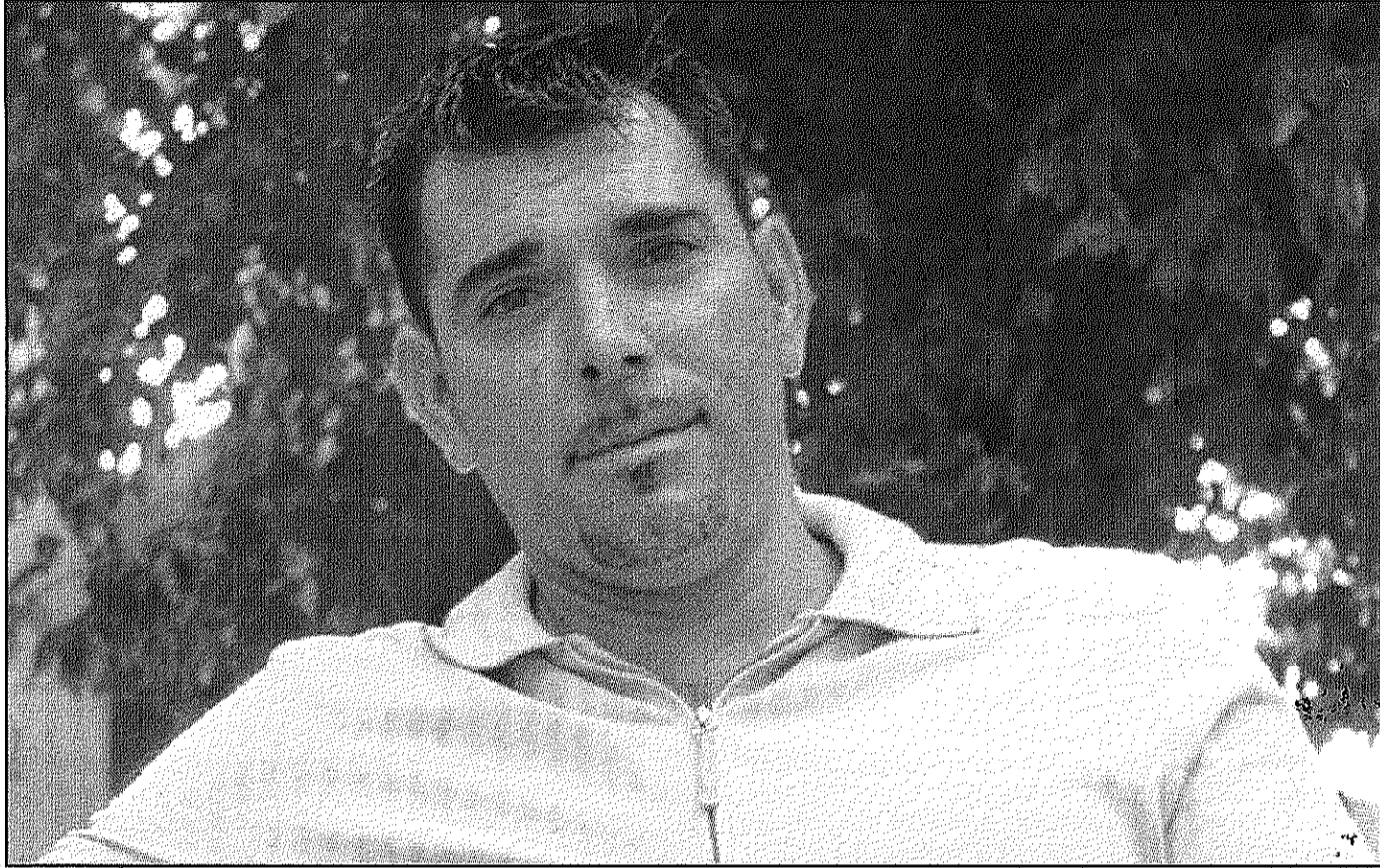
Víctor del Àrbol obrirà la nova proposta de 'Tast de Lletres' impulsada per l'Ajuntament, la Biblioteca i les llibreries locals (AIBM)

La regidora de Cultura de l'Ajuntament de Sant Celoni,