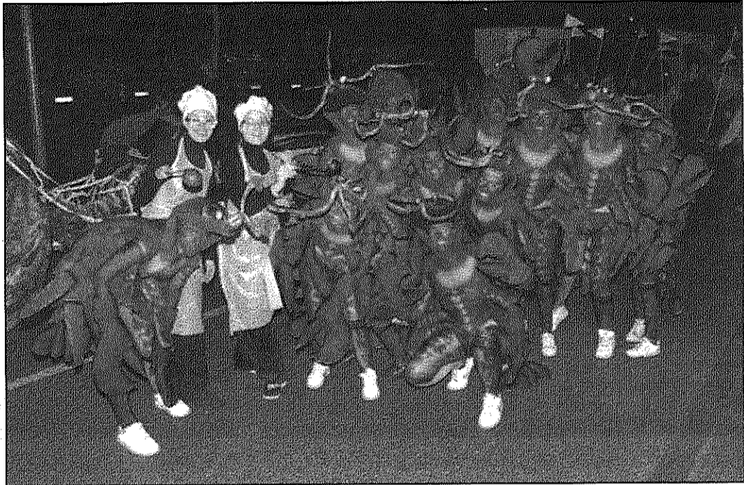
Arbúcies celebra el Carnaval avui, divendres, amb una rua pels carrers del centre (AdBM)

Cardedeu. L'Associació de veïns L'Estalvi organitzen per aquest dissabte, 18 de febrer, el sopar i ball de Carnaval, que començarà a les 9 del vespre a la Sala polivalent Tèxtil Rase. Durant aquest sopar ball es repartiran tres premis: el premi a la disfressa més elaborada, el premi a la disfressa més divertida i el premi a la disfressa més original. Per fer les reserves pel sopar, que té un preu de 12,50 euro, cal trucar al telèfon 938.460.475. El mateix dissabte, al Tarambana a partir de les 11 de la nit també hi haurà ball de disfresses amb dj's i premis per a les millors disfresses. Per altra banda, l'endemà diumenge tindrà lloc la rua de carnaval que organitza l'Ajuntament de Cardedeu, el Patronat Municipal de Cultura i la Comissió Carnaval 2012. La rua començarà a dos quarts de 12 del matí amb la concentració de totes les comparses a la plaça Joan Alsina i seguirà diferents carrers de la vila fins arribar a la plaça de Ramon Macipí on es farà el judici i la crema del rei Carnestoltes i s'entregaran els premis i records de la festa. A més, el Mercat municipal ha organitzat el primer Concurs de disfresses per aquest dissabte a les 12 del migdia. El certamen premiarà la frescor, la qualitat i la disfressa més economitada. Els guanyadors rebran un premi en vals de compra per gastar a