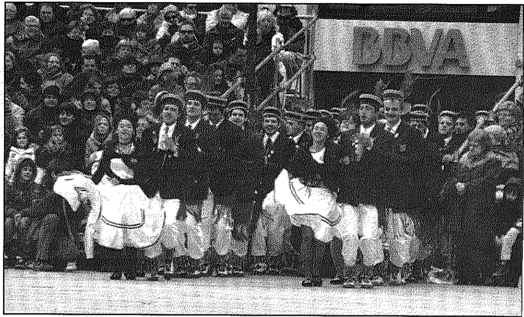
Balladors, diablots, Vell i Vella i Capità de cavalls ocuparan la plaça de la Vila el 19 de febrer (A&BM)

D'altra banda, també s'ha demanat als veïns de Sant Celoni que comencin a ambientar la celebració. Sota el lema 'per Carnaval, mantons a les finestres i als balcons'