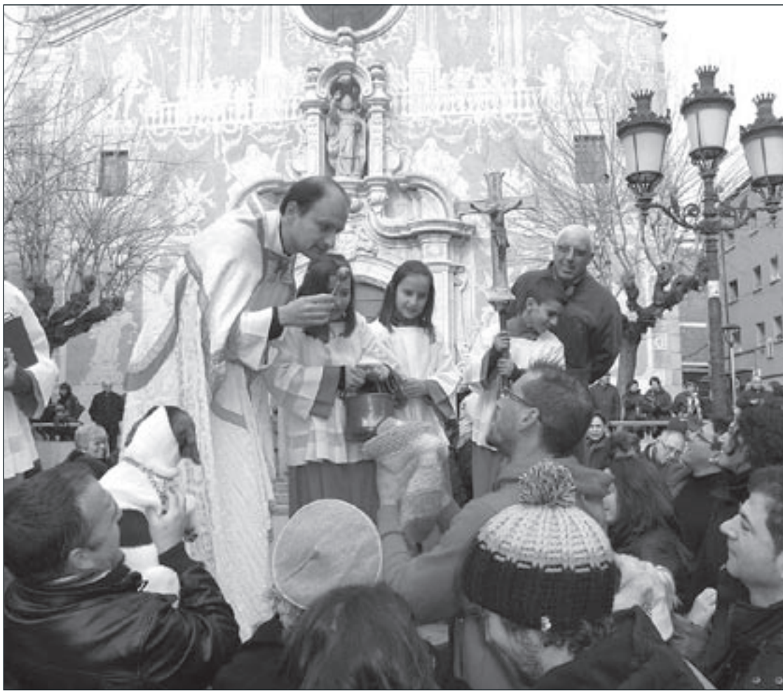
Durant la festa de Sant Antoni Abat es van beneir una trentena d'animals, a la plaça de l'Església

Puntualment i en una petita i ràpida cerimònia, que va durar poc més de 15 minuts, els prop de 30 cavalls i els 4 burros que van participar a la cercavila van rebre, un per un, la benedicció. Posteriorment, i mentre els cavalls van seguir fent una petita cercavila pels carrers del municipi, els animals domèstics, la majoria gossos, acompanyats dels seus amos, van prendre tot el protagonisme de la diada i van ser beneïts.