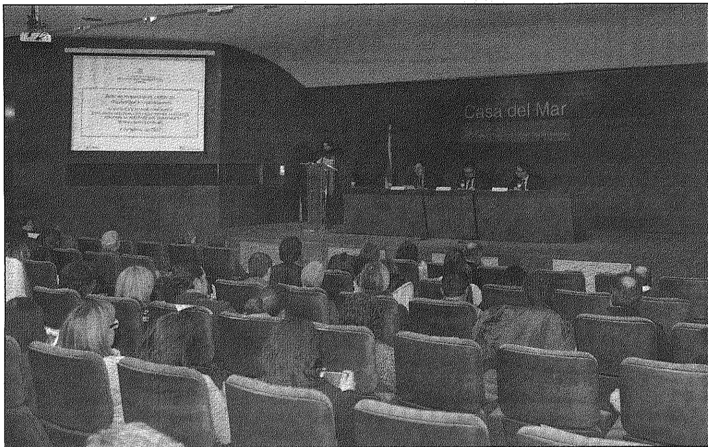
Una imatge de l'acte de lliurament de diplomes celebrat aquest dimecres a la Casa del Mar de Barcelona

A l'acte, el conseller va destacar "el valor de l'esforç de formar-se" i va recordar als alumnes que on podran desenvolupar la seva feina és en el marc de la Llei de la Dependència, una norma que "s'està desplegant de manera important amb un 40 per cent més de beneficia-