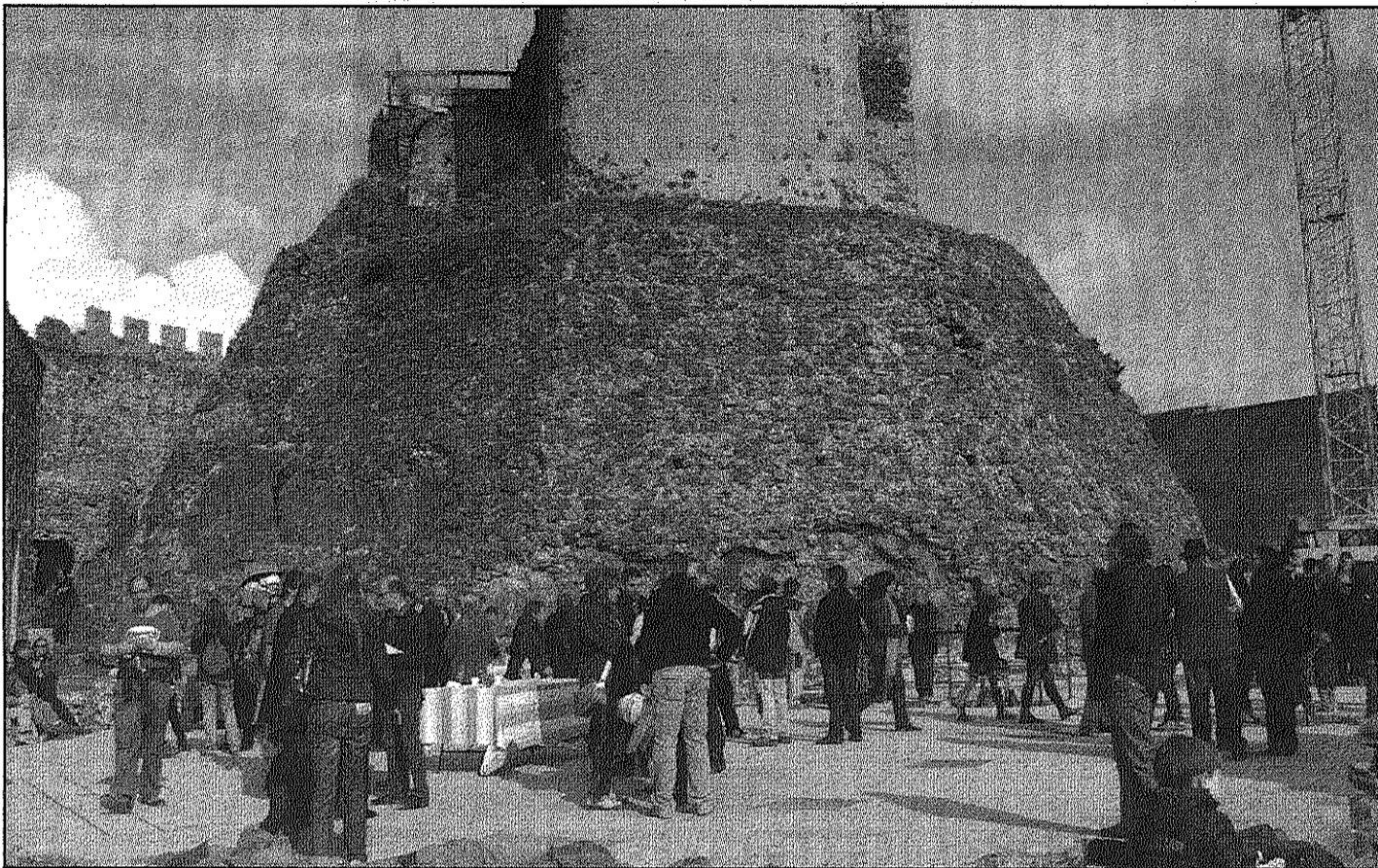
Una imatge de l'obertura del Castell de Montsoriu del gener del 2011

L'Orquestra Jove de la Selva repetirà actuació al Castell de Montsoriu, com ja va fer l'any passat, i enguany, ho farà amb una interpretació de guitarres a partir de les 11 del matí, hora en què s'iniciaran els actes institucionals. L'actuació de l'Orquestra Jove