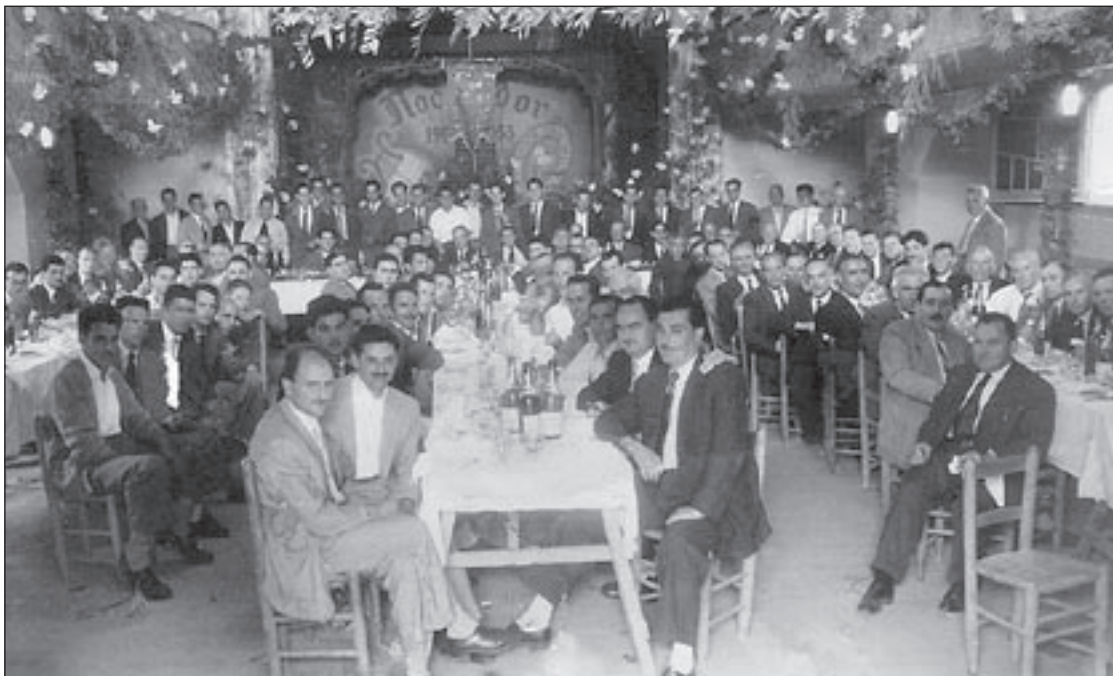
Celebració de les noces d'or de la Germandat de Sant Sebastià l'any 1953