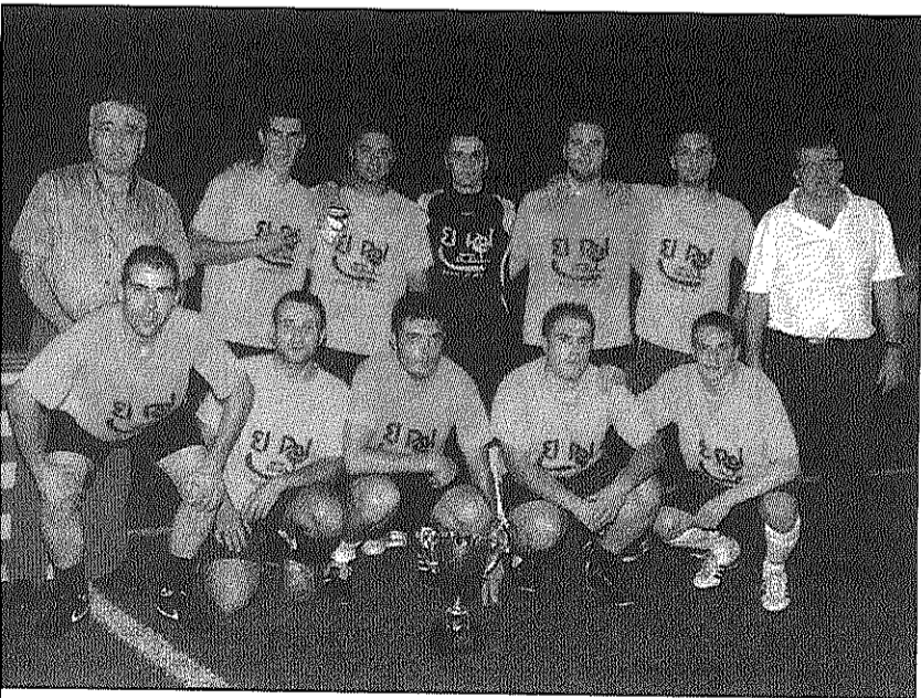
Els guanyadors de l'edició d'enguany de la competició

REDACCIÓ. Breda L'equip Pícnic el Pol s'ha imposat a l'edició d'enguany del Torneig de Futbol 7 que organitza anualment la UE Breda al municipi. L'equip es va imposar a la final als sots-campions del torneig, la Penya Blanc Blava de Breda, en un partit que es va tancar amb un 2-4 al marcador final.