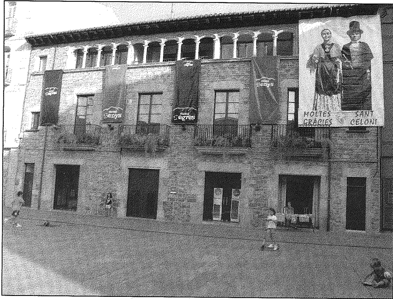
la colla ha penjat una gran pancarta a la façana de Can Ramis per agrair el suport de la vila als gegants

Una altra de les novetats seran els tallers que dimecres l'entitat oferirà al seu local del carrer Sant Pere a les 7 de la tarda, perquè petits i grans puguin pintar samarretes amb el logotip de la colla, coneixin aquest espai i es puguin emprovar les figures. A la nit, el tradicional sopar que els geganters