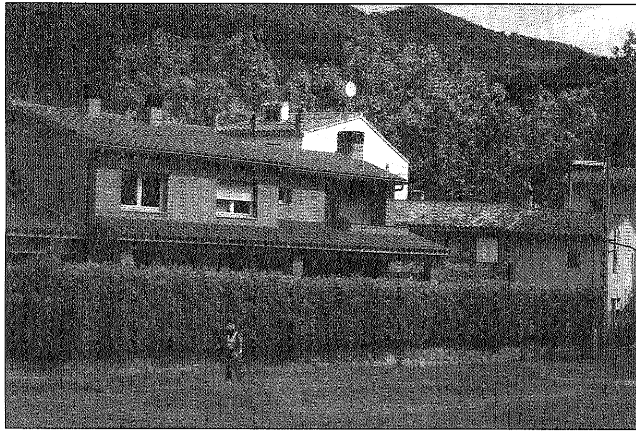
La Fundació Acció Baix Montseny ofereix, entre altres, servei de jardineria als municipis de la comarca (AdBM)

REDACCIÓ. Sant Celoni La 1a Convocatòria d'Ajuts Unnim ha subvencionat amb 1,5 milions d'euros 141 iniciatives socials, culturals o ambientals de l'àmbit de la caixa. Entre aquestes hi figura el projecte d'integració sociolaboral de persones amb discapacitat psíquica en serveis forestals i de jardineria que impulsa la Fundació Acció Baix Montseny, amb seu a Sant Celoni, que rebrà de l'entitat un total de 6.000 euros.