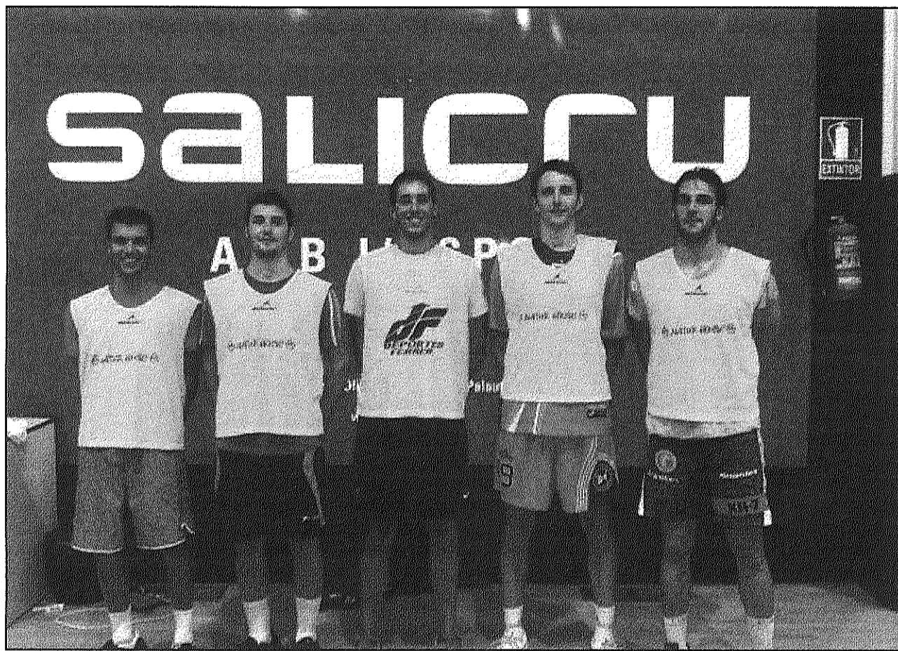
Una imatge dels cinc nous jugadors que incorpora aquesta temporada l'Handbol Palautordera (AdBM)

■ L'equip disputarà, a partir del 6 de setembre, tres partits de pretemporada a casa