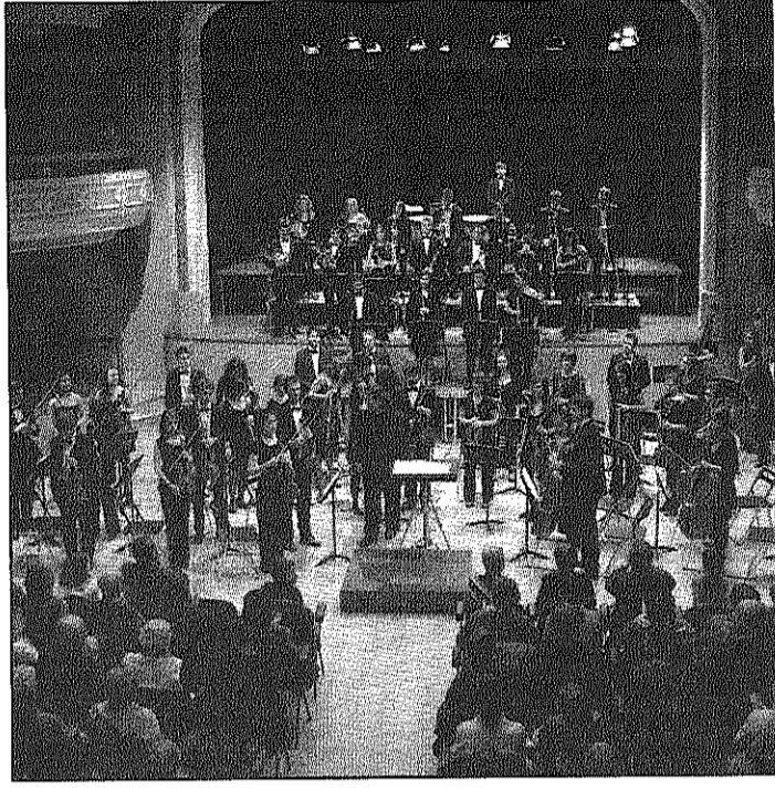
Una imatge del concert de la JONC a l'Ateneu (A4BM)