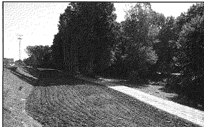
Els terrenys es troben al polígon Molí de les Planes (AdBM)

L'Ajuntament de Sant Celoni va obrir ahir, dijous, 12 de gener, el període per demanar una llicència per a l'ús dels nous horts públics que s'han habilitat al polígon Molí de les Planes. Les peticions es podran fer fins el 27 de gener a l'Oficina d'Atenció Ciutadana de Sant Celoni i a la de la Batllòria. El Consistori s'ha ocupat de fer l'endrega i condicionament de la zona verda paral·lela a la Tordera on es troben els nous horts després que la legislatura passada s'aprovés una iniciativa de la CUP que demanava la creació de l'espai. El nou parc d'horta municipal del polígon Molí de les Planes està format per 49 parcel·les d'entre 59 i 120 metres quadrats, distribuïdes en dos sectors. A cadascuna de les parcel·les hi ha una presa d'aigua amb comptador, un compostador, un bidó per a l'emmagatzematge d'aigua i un recolzador de canyes. Cada parcel·la també té un armari d'eines en un dels dos edificis comunitaris. Qualsevol veí de Sant Ce-