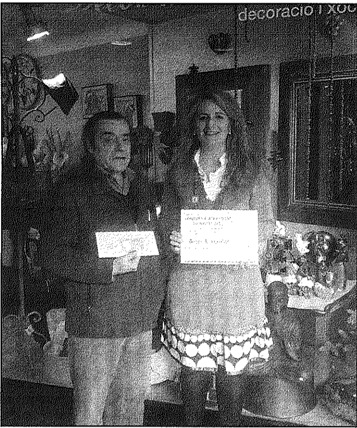
Imatge del lliurament del premi a Decor&Xocolat (AdBM)

D'altra banda, el passat 30 de desembre es va tancar el Concurs d'Aparadors de Nadal 2011 organitzat per Sant Celoni Comerç. Després del recompte de les votacions recollides dels clients es va poder comprovar com l'aparador més votat era el de Decor&Xocolat, que es va proclamar guanyador d'aquesta edició, seguit, per