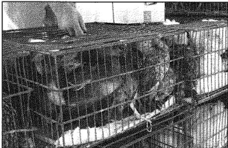
Libera! denuncia el tractament dels animals als mercats (Libera!)

Libera! ha presentat com a proves vídeos i fotos on diversos animals, com conills, ànecs, polls, gallines, porcs vietnamites i altres bèsties, estan en condicions pèssimes a nombrosos mercats catalans. L'entitat destaca que molts dels animals que s'ofereixen a la venda estan