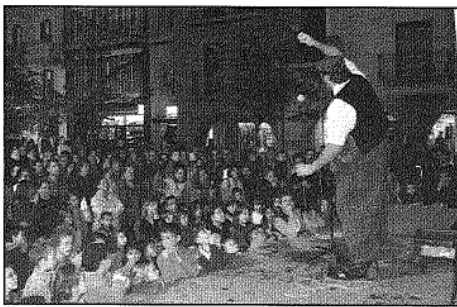
Una imatge d'aquesta edició de la Castacabranyada (AABM)