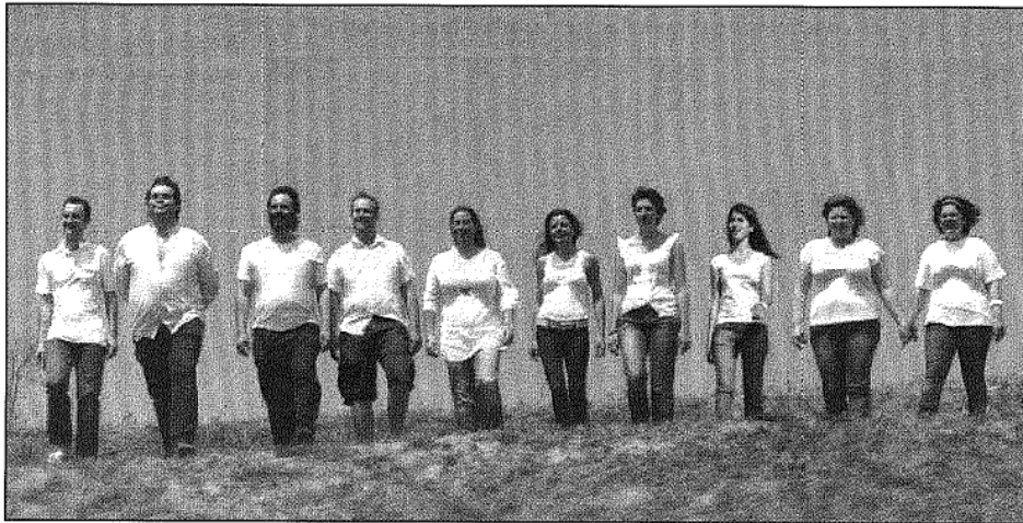
Els integrants de la companyia cardedeuana interpreten l'única obra amb protagonistes catalans de l'autor anglès (AABM)