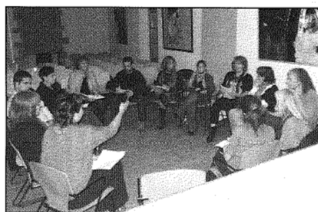
Les AMPA van celebrar dimecres una reunió (AABM)