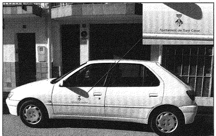
Un vehicle municipal aparcat aquest dimecres davant d'un gual a un domicili de la Batllòria

Un cop instal·lat el gual, però, assegura, "avui dimecres" davant la meua sorpresa em trobo amb un cotxe de l'Ajuntament aparcat ben bé tapant tot el gual". El veí afegeix que al carrer hi havia "lloc de sobres" per aparcar sense cometre cap infracció, però el vehicle municipal va ser aparcant davant la seva entrada entorpirant el pas.