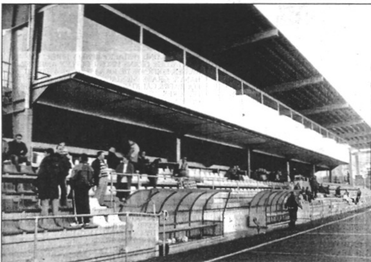
Imatge de la nova grada del Camp Municipal d'Esports (L'ABRM)

La presentació dels aiguamolls de les Llobateres d'aquest diuenge està oberta a tots els veïns del municipi i per aquest motiu l'Ajuntament habilitarà un servei d'autocar gratuït que sortirà des de Sant Celoni i des de la Batllòria.