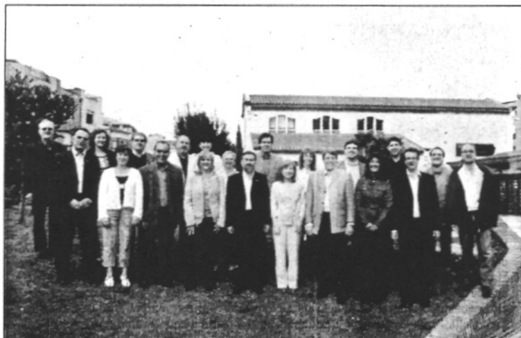
Els integrants de la candidatura del PSC a les properes eleccions municipals (L'ADBM)

La xifra de consultes, segons el PSC, seria el resultat de la periodicitat amb que s'incorpora informació a la pàgina. De fet, el degoteig de propostes i informacions que hi apareixen s'adiu amb el model de campanya electoral que estan impulsant els