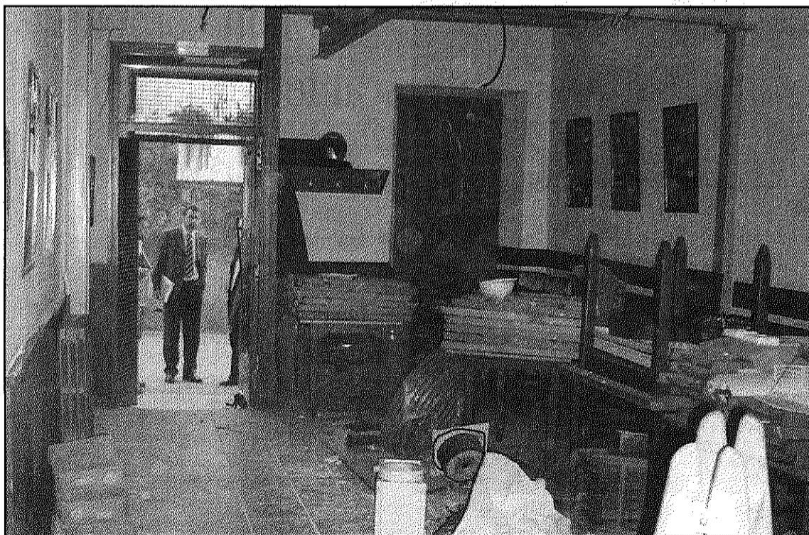
Les obres de reforma del Casal del Poble de Vallgorguina durant aquesta setmana

Les obres s'aprofitaran també, segons el regidor, per canviar la instal·lació elèctrica per una