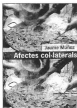
AFFECTES COL·LATERALS Autor: Jaume Muñoz Editorial: EL 9 NOU Preu: 12 euros

L'autor és un periodista valencià que des de l'any 1989 treballa a Ràdio 9, l'emissora autonòmica de València. Anteriorment havia treballat en el camp de l'ensenyament.