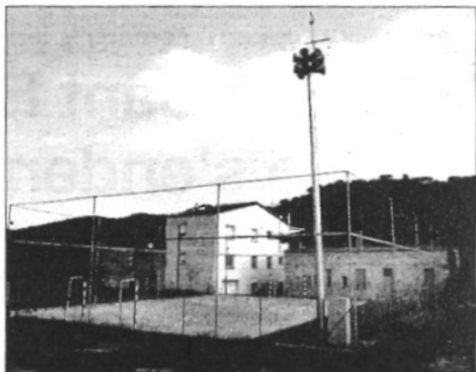
Una de les sirenes habilitades per alertar en cas d'accident químic

La prova forma part del Pla d'Emergències del sector químic de la Tordera (Plaseqtor), que recull mesures de prevenció d'accidents en una zona amb molt pes de la indústria química. Onze municipis catalans van fer proves de 16 sirenes químiques, en una pla de la direcció general d'Emergències.