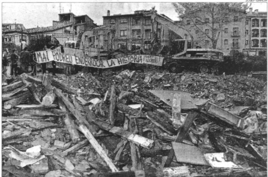
►► Manifestants a la zona dels enderrocs de les Adoberies de Vic, ahir.